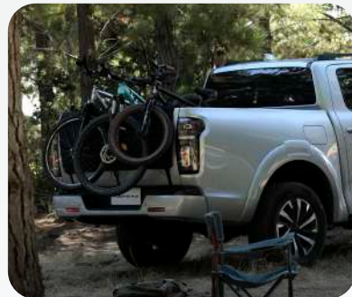
Capacidad de hasta 1,050 Kg con pasajeros