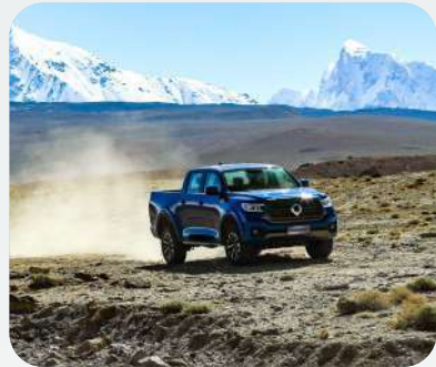
Motor 2.4 Turbo Diesel con 180 HP y 480 NM