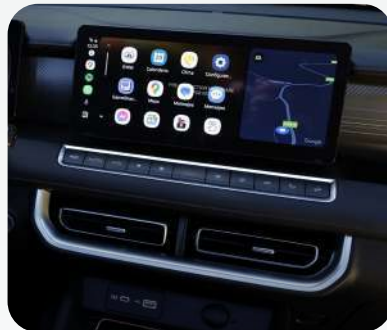
Pantalla Táctil de 12.3" y Cámara 360°