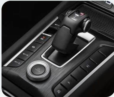
Caja automática de 9 velocidades