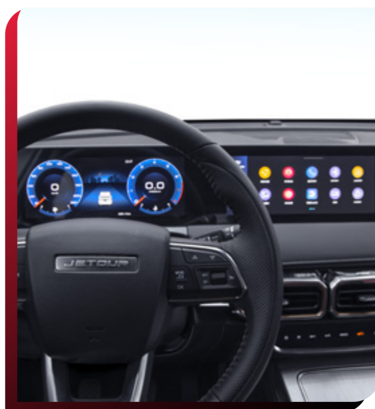
SISTEMA DE INFOENTRETENIMIENTO Y MIRROR LINK