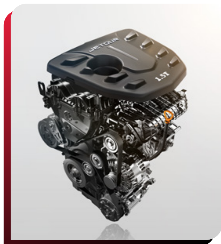
MOTOR 1.5 / 1.6 TURBO

Pon a prueba la resistencia de esta gran SUV