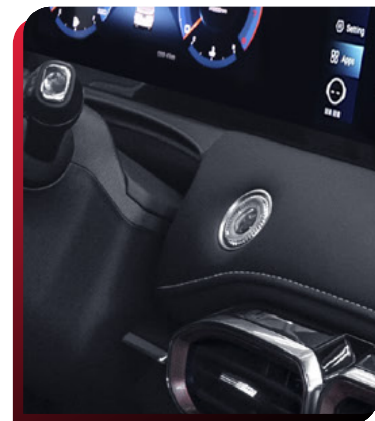
SMART KEY (BOTÓN DE ENCENDIDO)